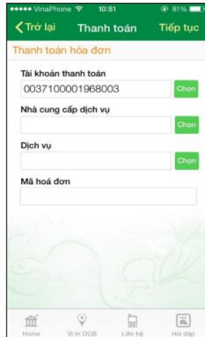
Nhập thông tin thanh toán hóa đơn