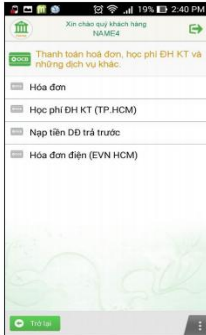
Màn hình chức năng thanh toán