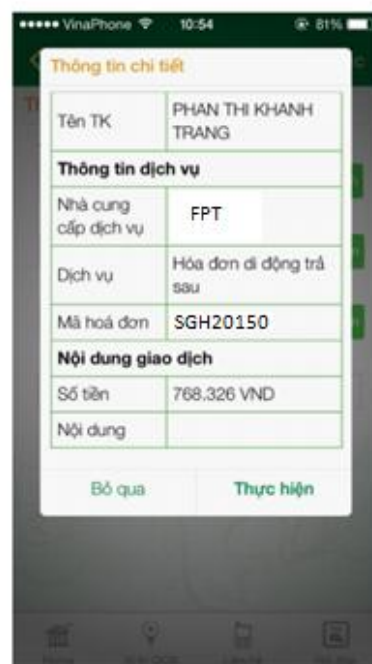
Kiểm tra thông tin